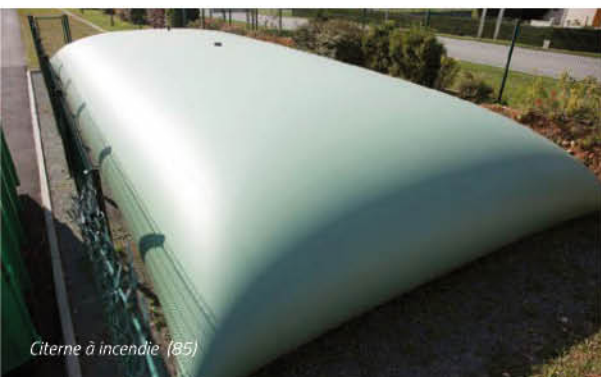
Citerne à incendie (85)