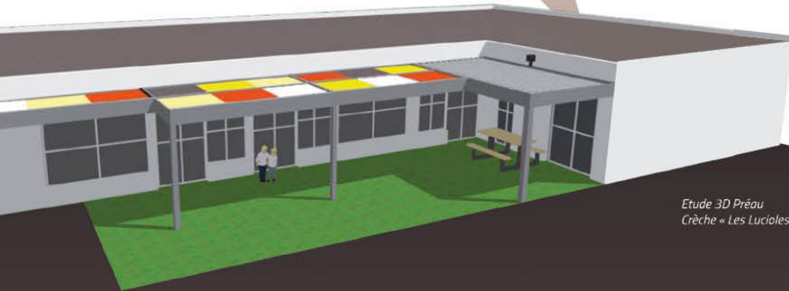
Etude 3D Préau Crèche « Les Lucioles » (79)

Les textiles Serge Ferrari sont reconnus pour leur robustesse et leur entretien facile. À l'initiative du Groupe Serge Ferrari®, les matériaux composites souples polyester sont recyclés. L'objectif est de produire de nouvelles matières premières qui seront ensuite réutilisées dans des productions industrielles.