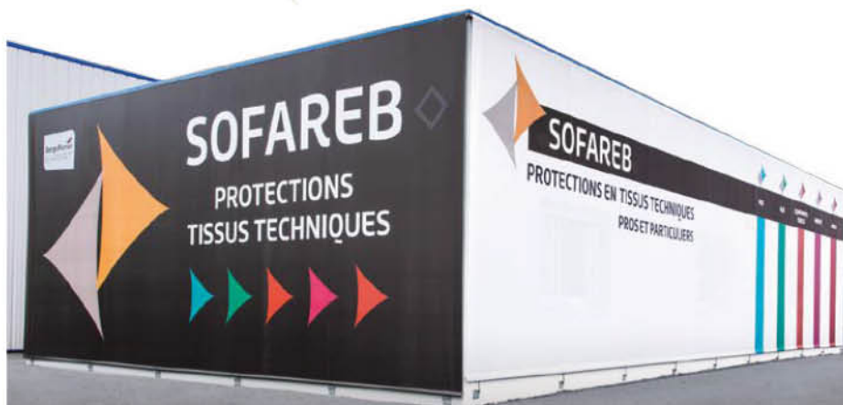
Façade textile (85)