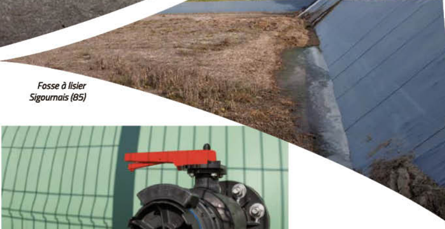
Fosse à lisier Sigournais (85)