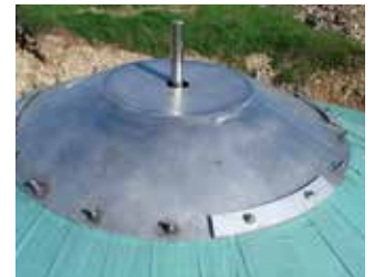
Coupole de maintien 316 L