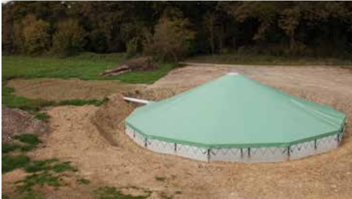
Mervent- Vendée (85)