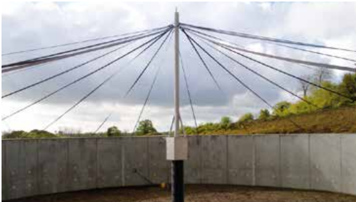
Haubanage du mât central

▪ INOX 316 L pour une meilleure longévité